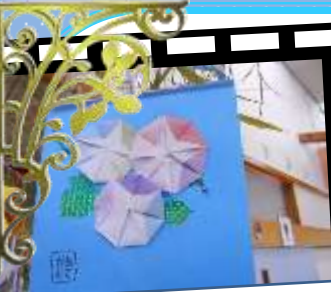
七夕に朝顔を飾り付け