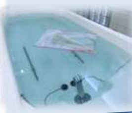
少し分かりづらいですが、入浴前の菖蒲湯の風景です

七月は例年通り七夕を行いました。施設においても外部イベント中止となり、イベントとしても今年には七夕飾りだけと非常にシンプルになっております。コロナ終息を願うとともに今出来る事で皆様と楽しく過ごせたらと思っております。 感染対応を実施している中でも、楽しく過ごせるように、密集密接密閉を避けるようにして今年度も行事を行わせて頂きます。