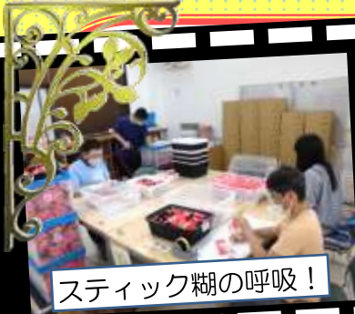
スティック糊の呼吸！