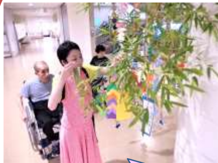
七夕の飾りつけ！（足柄療護園）