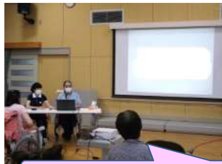
7月、利用者講演による職員研修