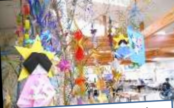
七夕飾り付け完了!