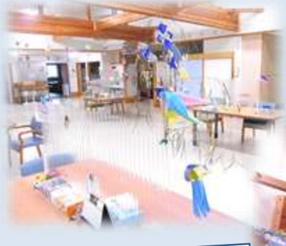
各席の亚克力板にもミニ七夕飾り!

例年ならば、一般的な七夕飾りのみでしたが、今年が初めて「天の川」を創作で制作しました。