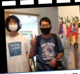
七夕。願い事叶うかな？